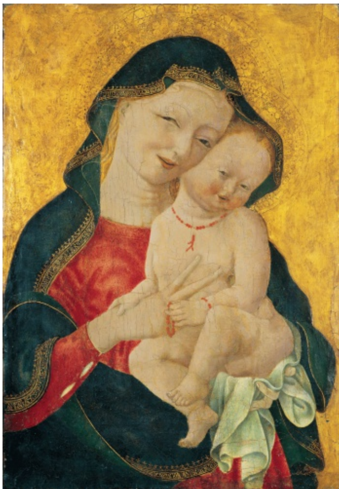
Majster žmurkajúcich očí: Usmievavá Madona s dieťaťom (cca 1450)