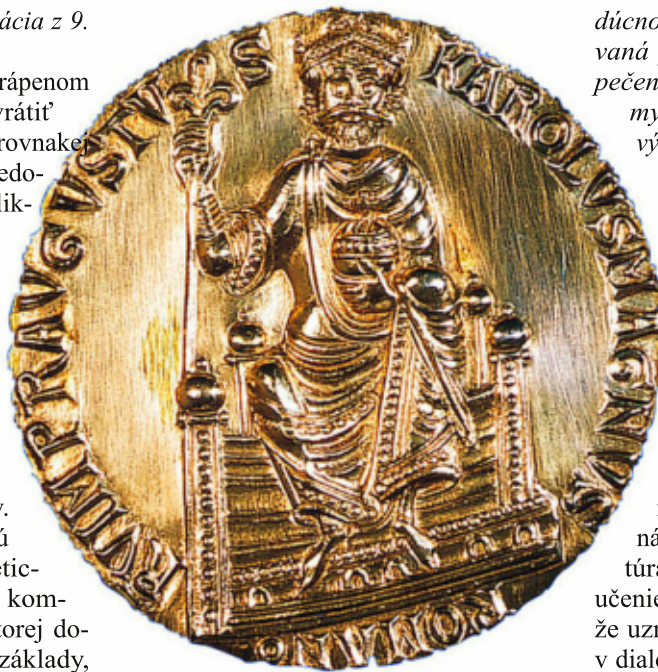
Medaila Ceny Karola Veľkého

Erich Przywara, vo svojom veľkolepom diele Idea Európy , nás vyzýva, aby sme si predstavili mesto ako miesto spoluzitia medzi rôznymi subjektmi a úrovňami. Poznal tú splošťujúcu tendenciu prítomnú v každom pokuse vymyslieť a vysnívať si sociálnu štruktúru. Mnoho našich miest je obzvlášť nádherných práve preto, lebo dokázali časom uchovať stopy rôznych vekov, národov, štýlov a vízií. Stačí sa pozrieť na neoceniteľné kultúrne dedičstvo Ríma, aby sme si uvedomili, že bohatstvo a hodnota určitého národa je založená na jeho schopnosti poprepájať všetky tieto úrovne zdravého spoluzitia. Reduktívne formy a všetky pokusy o uniformitu, ktoré majú ďaleko od vytvárania hodnôt, odsudzujú naše národy ku krutej chudobe: k chudobe vylúčenia. A vylúčenie má ďaleko od toho, aby prinieslo veľkosť, bohatstvo a krásu. Naopak, vedie k zlobe, obmedzenosti a surovosti. Má ďaleko od toho, aby dodalo duchu ušľachtilosť – pri naša úbohosť.