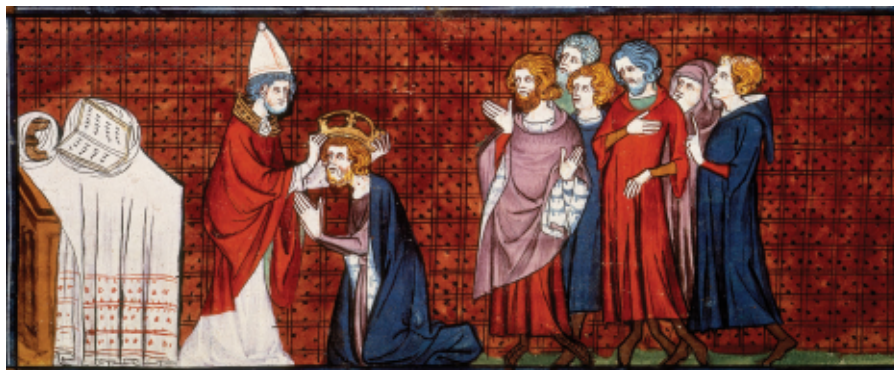
Na Vianoce roku 800 pápež Lev III. korunoval Karola Veľkého za cisára

Potrebujeme teda prejsť od peňažnej ekonomiky s tendenciou vytvárať priestor korupcii ako prostriedku na obohatenie sa, k sociálnej ekonomike, ktorá garantuje človeku prístup k pôde a k bývaní, a to prostredníctvom práce, kto-