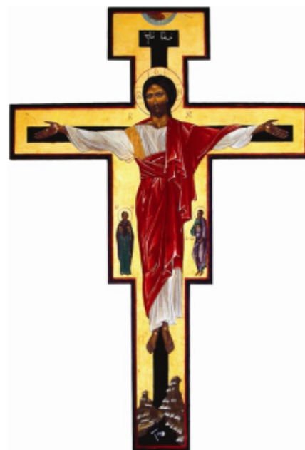
Tibhirinský Kríž zmŕtvychvstania