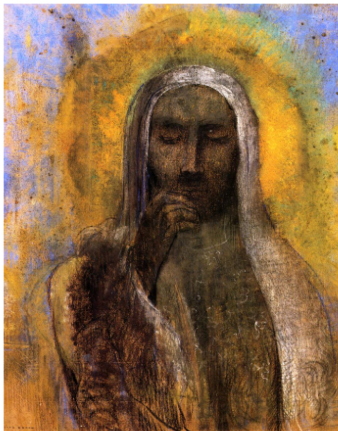
Odilon Redon: Kristus v tichu

Na začiatok možno stačí aj takéto roztrasené ticho. Aj pri ňom sa totiž dá aspoň na chvíľu nazrieť do úžasnej priepasti vlastnej hĺbky. A nič to, že len ukradomky, ponad okraj. Tá hĺbka mi už viac nedá spať. Ohuruje, láka, mámi. Akosi cítim, že len