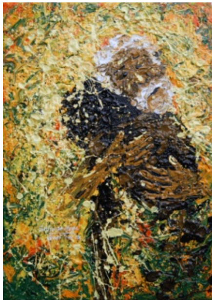
Neznámy: Márnotratný syn

Pápež svätý Ján Pavol Veľký rozoberá pojem milosrdenstvo v starozákonných významoch