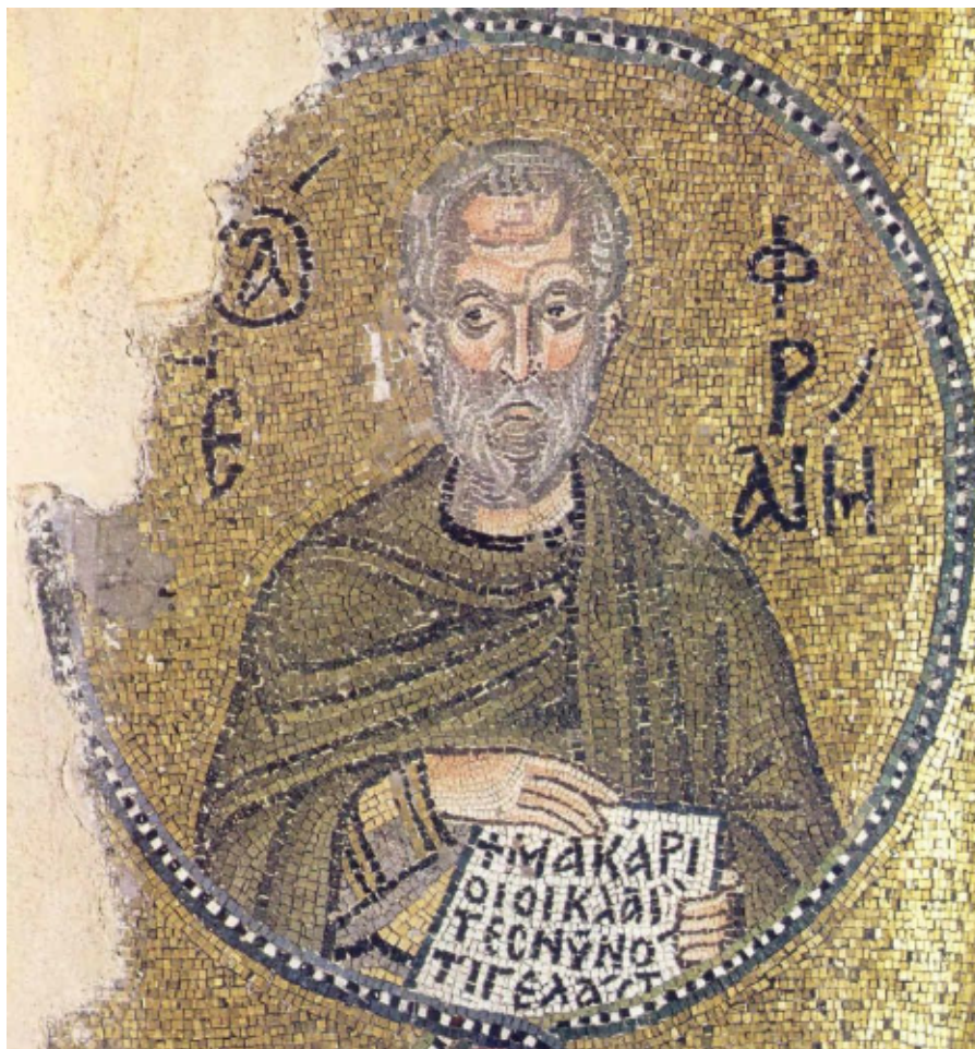
Sv. Efrém Sýrsky, 10. stor. Nea Moni, Grécko

Celý Veľký týždeň je orámovaný kontempláciou už blízkeho stretnutia Ježiša so smrťou, najskôr jeho stretnutia so smrťou priateľa a o týždeň neskôr jeho stretnutia s vlastnou smrťou. Liturgickým textom sa darí zatiahnuť nás do tejto Ježišovej cesty do Betánie, smerom do Jeruzalema. Vo východnej liturgii nikdy nie sme len divákmi, ale vždy aj účastníkmi a koncelebrantmi, sme prítomní v liturgii a v udalosti spásy, ktorú liturgia oslavuje. Večierňou Lazárovej soboty sa končí veľkopôstne obdobie.