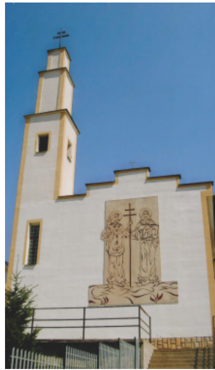
Cyril a Metod , Návojevce