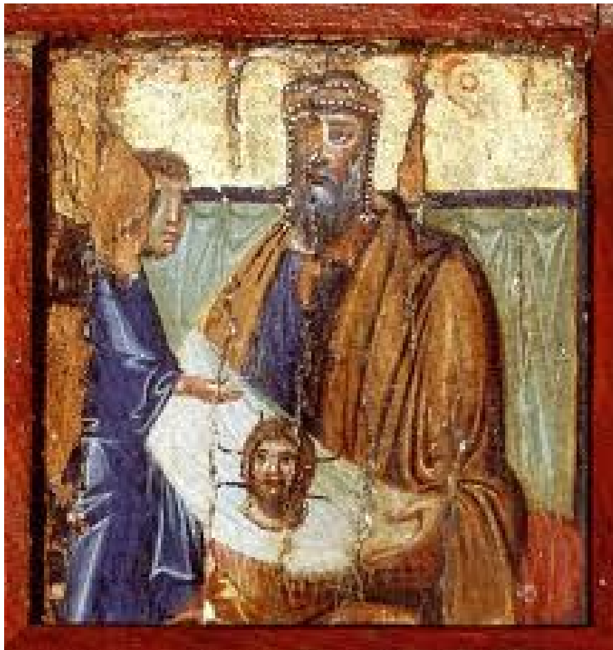
Kráľ Abgar s obrazom Ježiša, 10. stor.

Vo východnej cirkvi trvá pôst prakticky 36 a pol dňa. Sedem týždňov pôstu bez sobôt a nedeľ tvorí 35 dní. K tomu treba prirátat Veľkú sobotu a polo-