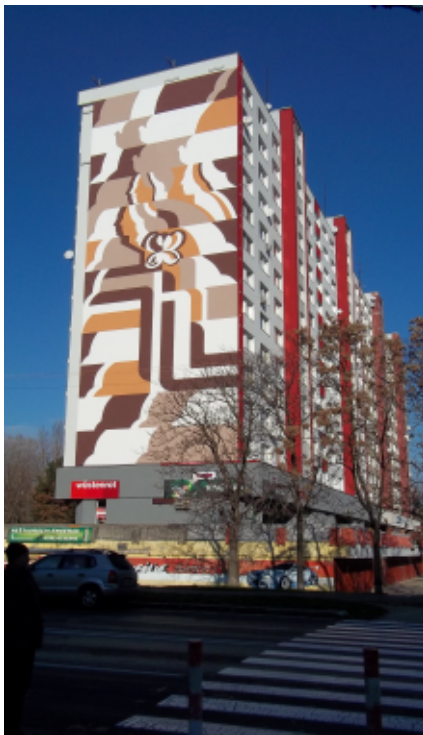
Mier , Bratislava-Petržalka