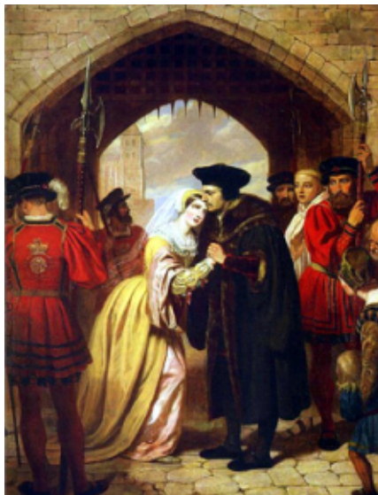
Edward Matthew Ward: Sir Tomáš Morus sa lúči pred popravou so svojou dcérou

Tomáš veril, že získa kráľa pre reformu a privedie ho k politike, čo by uľahčila situáciu chudoby. Namiesto toho sa s ním však dostal do ostrého konfliktu, ktorý sa ťahal od roku 1527. Odvtedy chcel kráľ dosiahnuť u pápeža Klementa VII. vyhlásenie neplatnosti svojho manželstva s Katarínou Aragónskou. Keď sa to nepodarilo prostredníctvom dlhoročného kancelára kardinála Wolseya, skúsil dosiahnuť svoj cieľ pomocou vysoko váženého Tomáša Mora. Tomáš bol kráľovi verný a ochotne mu spíňal všetky jeho želania, okrem tých,