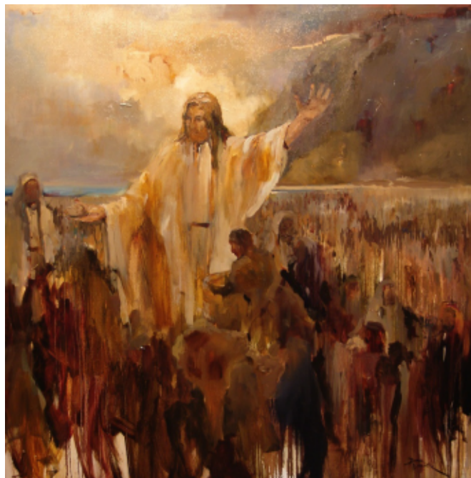
Dirk Walker: Reč na vrchu

Ale to nie je všetko. Kristus tieto nelogické paradoxy od nás žiada! Jeho „no ja vám hovorím“ je jasná požiadavka, nut-