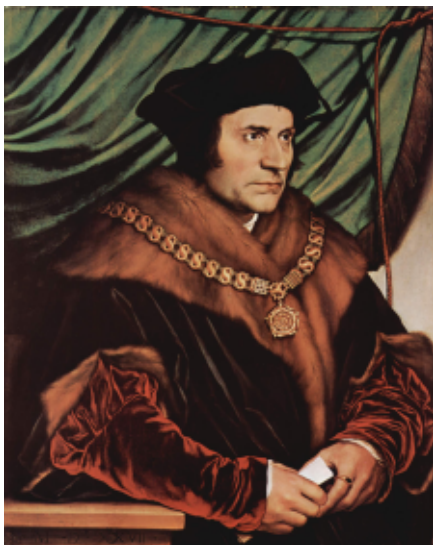
Hans Holbein ml.: Sir Tomáš Morus

Sv. Tomáš Morus rešpektoval autoritu kráľa, no odmietol ju vyzdvihnúť nad Božiu