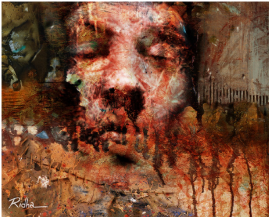
Ridha: Tiché utrpenie III.

Napokon, Boh prehovára v hĺbinách nášho vedomia, a ak odmietame otvoriť sa a nazrieť do týchto hĺbok, potom