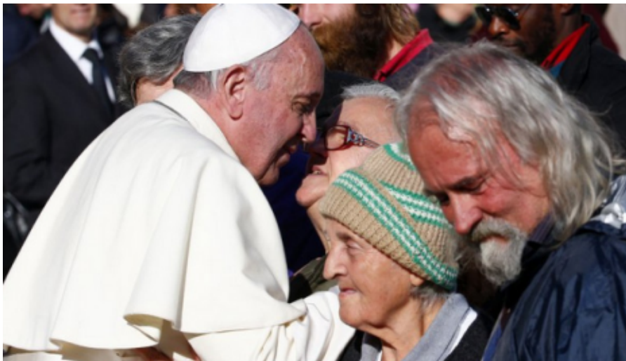
Pápež František sa s bezdomovcami stretol viac ráz

Nie, rozhodne nie. Poviem vám však niečo dôverné. Keď som bol malý, neexistovali obchody, ale všetko sa predávalo na trhu, kde bol mäsiar, zeleninár a tak podobne. Chodil som tam na nákupy s mamičkou a babičkou. Bol som ešte maličký, mal som štyri roky. A keď sa ma vtedy pýtali, čím by som chcel byť, keď budem veľký, hovoriel som: Mäsiarom!