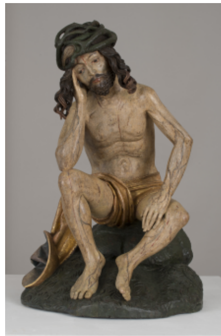
Odpočívajúci bolestný Kristus, (cca 1520), Majster Pavol z Levoče

Najpočetnejší súbor predstavujú zlatnícke diela z územia celého Slovenska. K nim sú v malom výbere zaradené aj ukážky textilnej produkcie a iluminátorskej tvorby. V Kvirinálskom paláci sa vystavujú napríklad tri najväčšie neskorogotické monstrancie, dve krstné misy či ukážky textilnej produkcie v po-