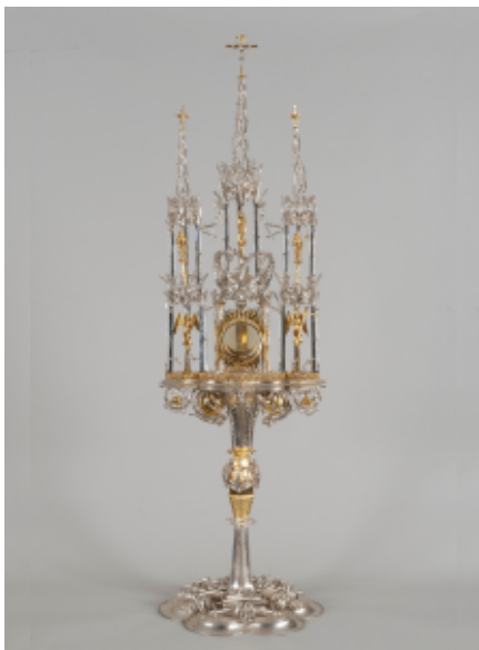
Monštrancia zo Spišskej Novej Vsi, okolo roku 1510

dobe zaujímavých bakačín, textílií, ktoré majú svoj pôvod v talianskej Perugii.