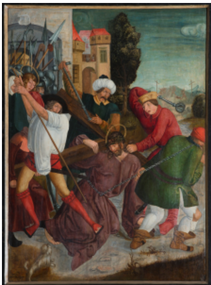
Kristus padá pod krížom, (1526), kostol v Lipanoch