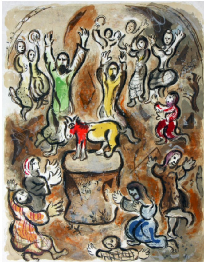
Marc Chagall: Adorácia zlatého tel'aťa

Aj keď asi nie som ďaleko od pravdy, radšej to nechám tak. Načo rozpitvávať vlastnú úbohosť. Dôležitejšie je, že sa začínam spoznávať: Som ten, ktorý si určite musí poriadne „rozmyslieť tie záväzné slová, skôr než ich vysloví“. A tak moje Krédo nadobúda nie Cirkvou schálenú podobu: Verím aj v jedného Boha. Je to síce smutné, ale poctivé. Je to konečne realita, a nie módna ilúzia. A vlastne – je to moja záchrana. „Lebo Syn človeka prišiel hľadať a zachrániť, čo sa stratilo“ (Lk