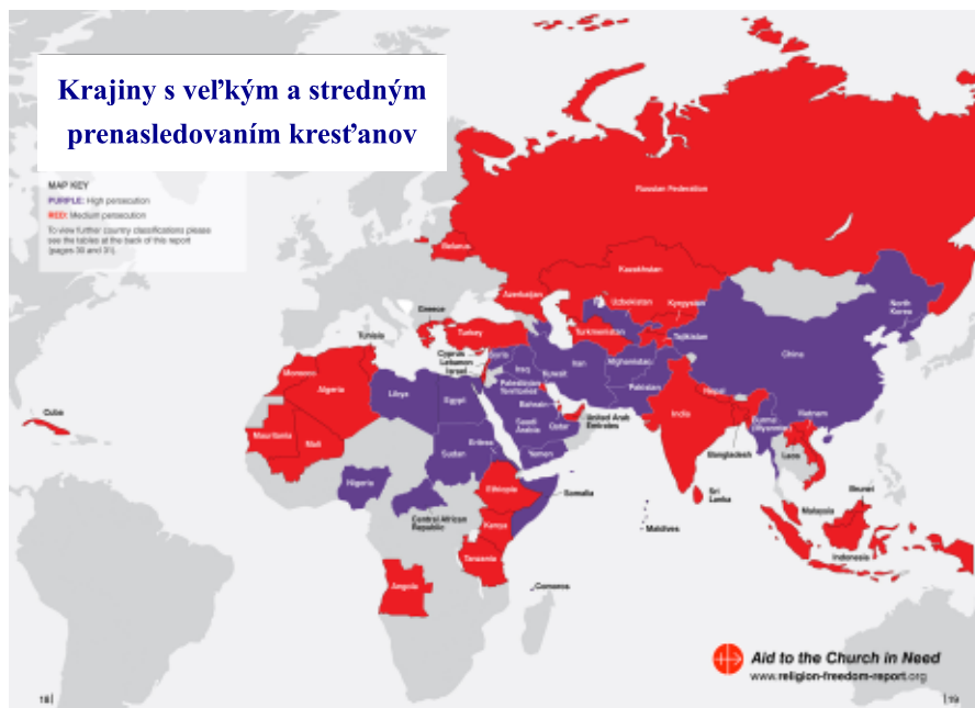
Prenasledovanie pre vieru: fialová farba - silné prenasledovanie; červená - priemerné

Aj napriek tomu je však v súčasnosti „náboženská sloboda ohrozená takým spôsobom, ako od nacistickej a komunistickej éry ešte nebola,“ povedal v ro-