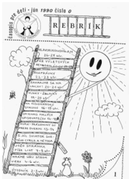
Nulté číslo časopisu Rebrík

Dieťa je hravé a zvedavé. Ak k nemu nepristupujeme priveľmi mentorsky, nechá sa motivovať aj k náročnejšej práci na sebe. Je dobre, keď ho zo začiatku niekto pri čítaní sprevádza a vedie k úvahám o prečítanom obsahu. Dieťa sa tak učí selektovať z ponúkaných článkov, vyberať z nich dôležité informácie