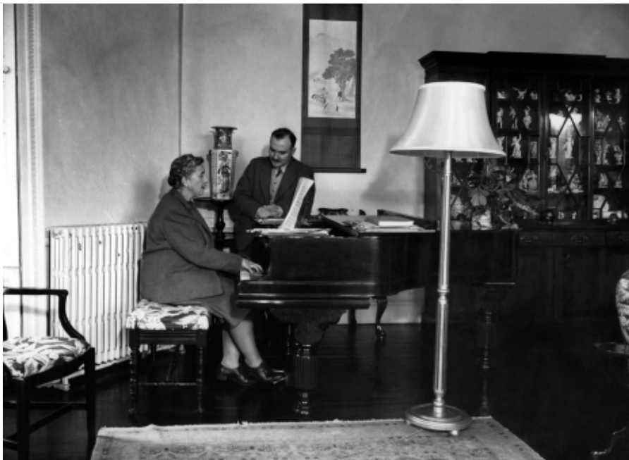
S druhým manželom Maxom pri svojej obľúbenej činnosti – hre na klavíri

Agatha Christie dostala viktoriánsku výchovu v anglikánskej viere, ale jej viera sa postupne vymaňovala z často pokryteckých medzí anglického „spoločenského náboženstva“ a získavala hlboké osobné presvedčenie. V pokročilom veku, keď nemohla chodiť, vyžiadala si, aby jej anglikánsky duchovný nosil „prijímanie“ domov, čo nebolo medzi anglikánmi vôbec obvyklé.