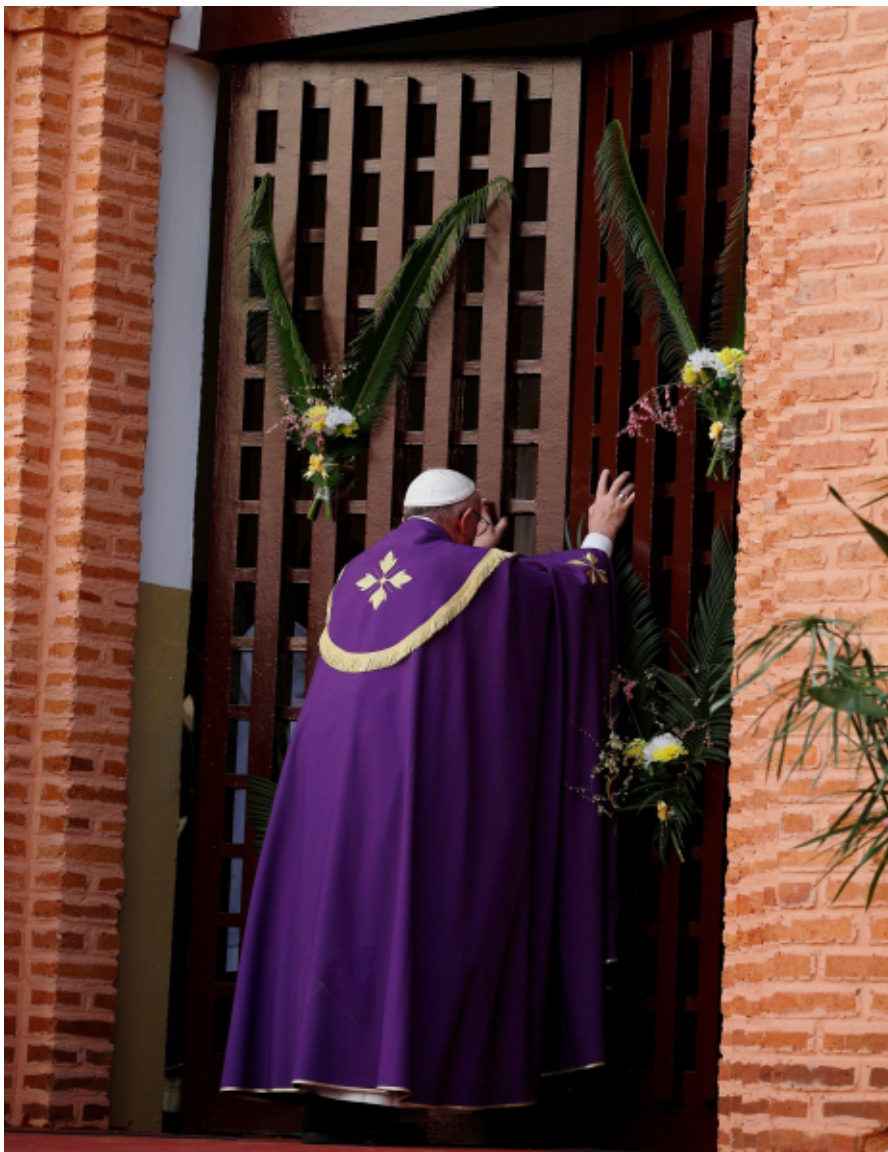
Svätý Otec František otvára Svätú bránu v Bangui v Stredoafrickej republike