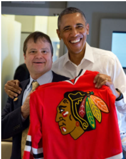
Ked' sa to politicky hodí, politická korektnosť ide bokom

Našťastie, nie všetci sú poslušní či „uvedomelí“ ako pracovníci holandského národného múzea umenia Rijksmuseum či niektorí knižní vydavatelia a rozhodli sa bojovať proti šialenstvu tzv. politickej korektnosti. Populárny tím národnej ligy amerického futbalu