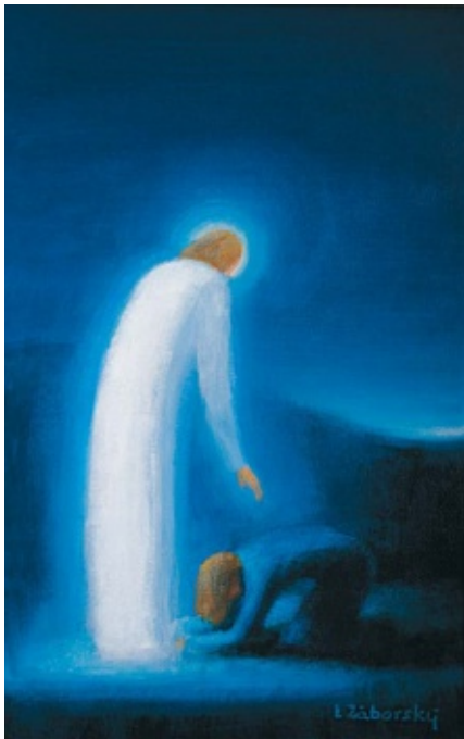
Vzkriesený Kristus a Mária Magdaléna

Po návrate z väzenia už nemohol učiť na martinskom gymnáziu. Zažíval dôsledky perzekúcie, nemohol sa zaradiť do spoločnosti, mal len minimálne pracovné príležitosti. Ponúkli mu lopatu, ale, našťastie, priatelia mu pomohli. Riaditeľ Matice slovenskej mu umožnil ilustrovať knihy ruského spisovateľa o prírode, ako aj Škultétyho Rečňovan-