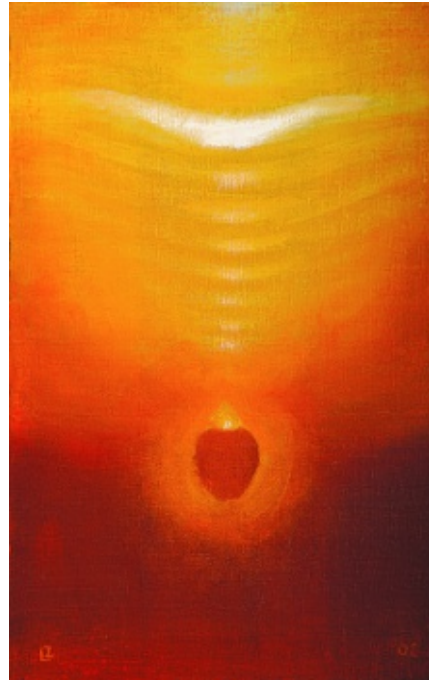
Sedem darov Ducha Svätého a duša