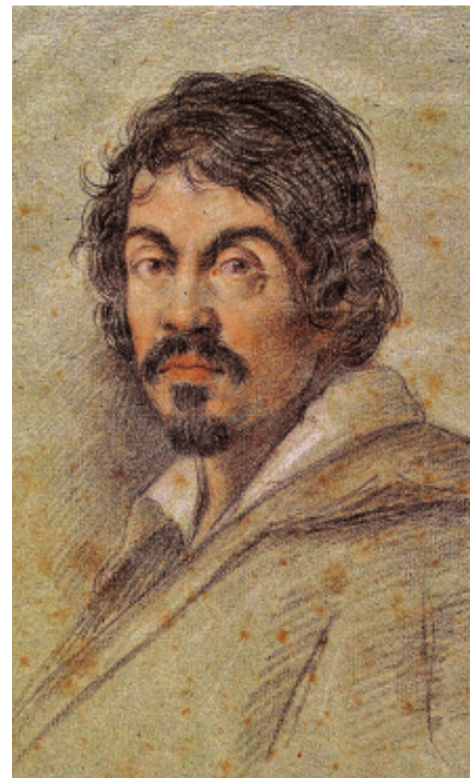
Ottavio Leoni: Caravaggio

Čo je na diele tohto autora také výnimočné? Na prvý pohľad zaujme technická dokonalosť vykreslenia postáv, v pozoruhodnej hre svetla a tmy, s jedinečným citom pre realitu a detail, takže jeho diela viacerí pripodobňujú k fotografiám, a to tak z hľadiska dokonale