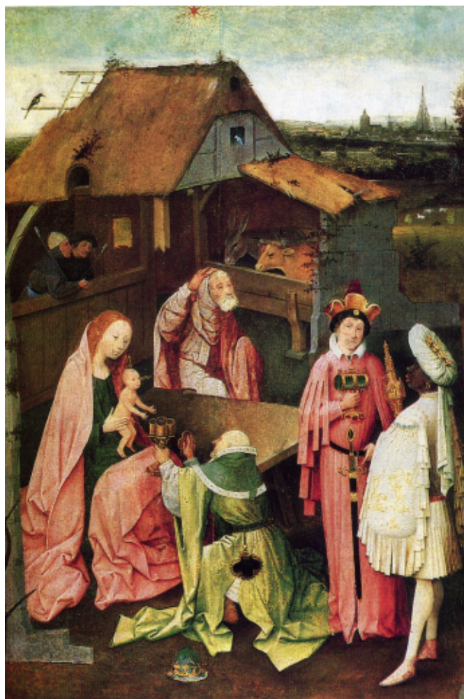
Hieronymus Bosch: Epifanía