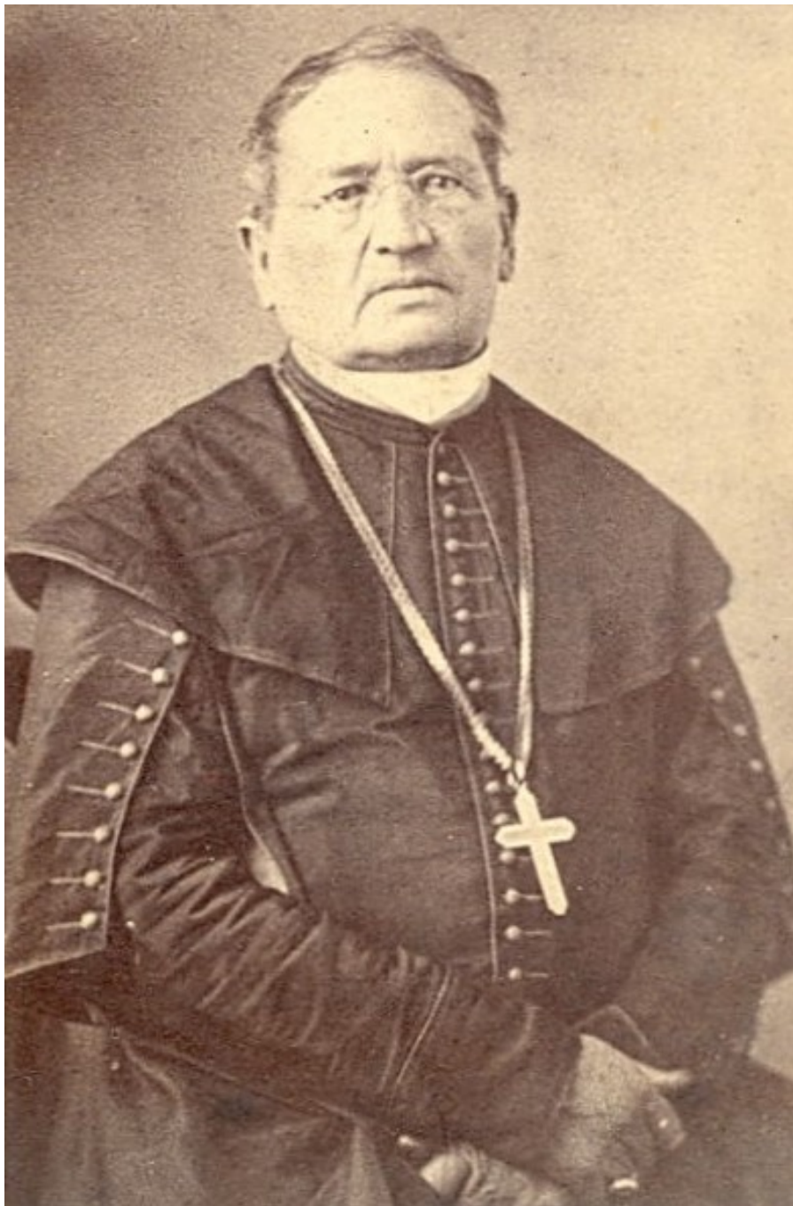
Banskobystrický biskup Štefan Moyzes

Nie všetci však zdieľali rovnakú radosť. Nechajme prehovoriť Bélu Grünwalda, maďaróna a podžupana Zvolenskej sto-