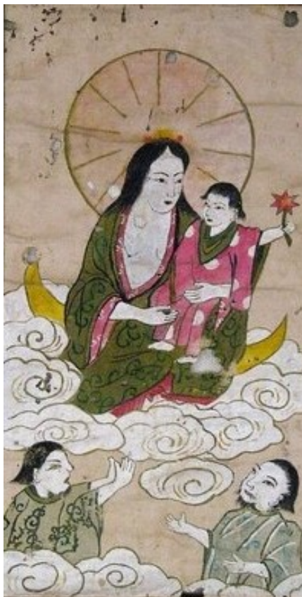
Panna Mária s mladým Ježišom Kvôli bezpečnosti zamaskovali skrytí kresťania kresťanskú symboliku do budhistických a šintoistických metafor.

Po zrušení prenasledovania kresťanov v Japonsku roku 1873 začali do krajiny vychádzajúceho slnka opäť prichádzať misionári, najmä z Francúzska. Keďže však uplynulo mnoho rokov od posledného stretnutia Japoncov s oficiálnym kresťanstvom, japonskí kresťania v podstate vlastnú vieru nepoznali. Mnohí sa nechali znovu pokrstiť, niektorí dokonca vstúpili do kláštorov. Našli sa však aj takí, ktorí sa rozhodli, že budú aj naďalej pokračovať v zdomácnenej forme kresťanstva ako kakure kirišitan , a to v rovnakom duchu, ako to bolo za čias prenasledovania a skrývania. Preto niet divu, že tu badať silné vplyvy šintoizmu a budhizmu, podobnosť možno vypozerovať predovšetkým pri jednotlivých rituáloch, najmä čo sa týka vzývania božstiev, čo si najmä v časoch