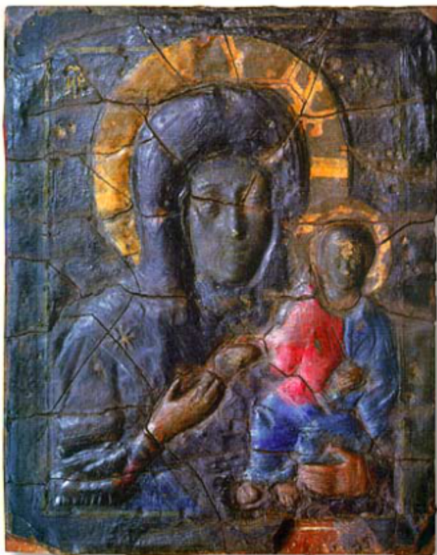
Bohorodička v Blachernach, 7. stor

Dňa 11. októbra 1962, teda dnes pred 48 rokmi otváral pápež Ján XXIII. II. vatikánsky koncil. Na tento deň pripadala slávnosť materstva Panny Márie, a tak chcel pápež Ján XXIII. celý tento koncil zveriť pod materskú ochranu Madony. Aj my začíname 11. októbra a tiež chceme zveriť túto synodu so všetkými problémami, výzvami a nádejami materskému srdcu Madony, Matky Božej.