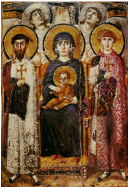
Theotokos medzi sv. Teodorom a Jurajom, cca 6. stor., Kláštor svätej Kataríny, Sinaj

Tento pád nie je len poznanie toho, že nie sú Bohom; je to proces premeny